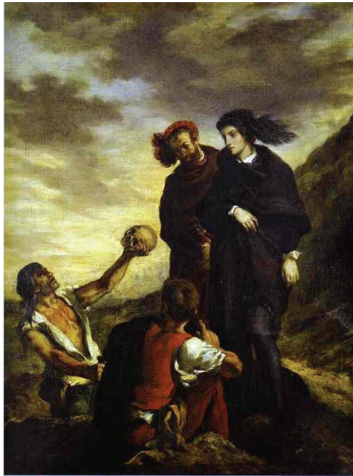
Eugène Delacroix, "Hamlet et Horatio au cimetière" (1839) Paris : Musée du Louvre (public domain)

auswählt. Über das wohl berühmteste dieser Bilder, dasjenige, das Hamlet in der Totengräberszene, über dem ausgehobenen Grab für Ophelia, zeigt,