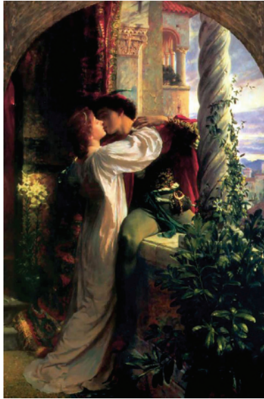
Frank Dicksee, Romeo and Juliet

gewählt wurde 4 und so manchen Buchumschlag von Ausgaben des Stücks schmückt: