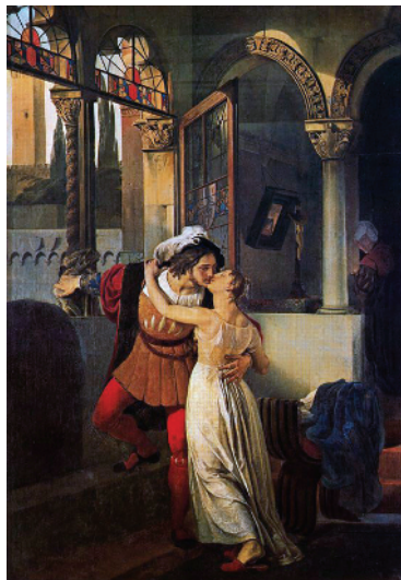
Francesco Hayez, L'ultimo bacio dato a Giulietta da Romeo

Schauen wir uns ein paar dieser Bilder an und beginnen wir mit Francesco Hayez' „L'ultimo bacio di Romeo e Giulietta“ in der Szene 3.5 (1823):