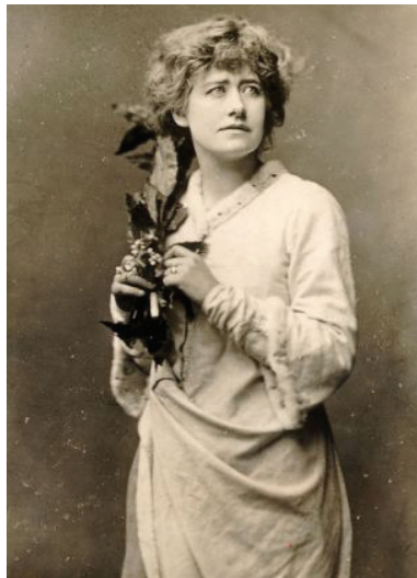
„Miss Ellen Terry as Ophelia in Shakespeare's Hamlet“ (Photo ca. 1878)

Shakespeares Ophelia hingegen, die für männliche Künstler des 19. Jahrhunderts eine Kultfigur war, ist für selbstbewusste weibliche Autoren und auch Schauspielerinnen eher ein Problem. Als Ellen Terry, die diese Rolle gegenüber Henry Irvings Hamlet zu spielen hatte, Ophelia ihrer Klage über den Tod des Vaters Polonius durch schwarze Trauerkleidung etwas mehr Eigenwert geben wollte, wurde sie barsch zur Ordnung gerufen. Sie musste auf das schon in Auftrag gegebene dunkle Kleid verzichten und, wie es seit jeher üblich war, in unschuldigem Weiß klagen und wahnsinnig werden: