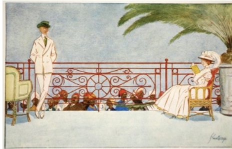
Lance Thackeray, „Romeo and Juliet–Balcony Scene at Shepheard's Hotel, Cairo“. The Light Side of Egypt . London: Adam and Charles Black, 1908.

Kairo versetzt und ihren Moment transzendentaler Liebe in eine moderne Geschichte von Flirt und Entfremdung übersetzt: