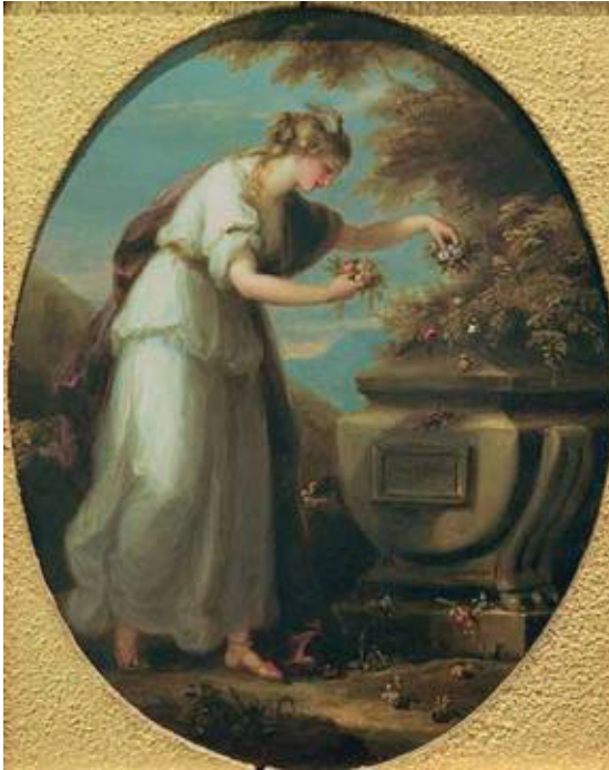
Angelika Kauffmann, Ausschnitt aus: „An Ideal Portrait of Shakespeare“ (1755)

1770er Jahren mit einem Idealporträt und einer Vignette, in der die personifizierte Phantasie sein Grab schmückt.