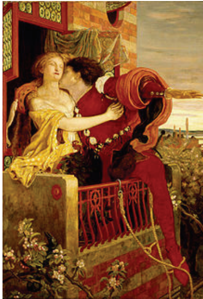
Ford Madox Brown, Romeo and Juliet

Die Perspektive hier, wie in meinem nächsten Bild, ist von der Höhe außen, und in beiden Fällen betont dieser schwindelnde Blickwinkel die dramatische Körpersprache sich verklammernder und baumelnder Körperteile. Im Fall von Ford Madox Browns prä-raffaelitischem Gemälde von 1871 ist jedoch die Körperhaltung der Liebenden unbeholfen und ungelenk eher als elegant wie bei Makart: