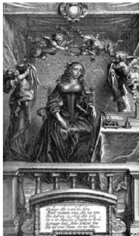
Margaret Cavendish, Frontispiz zu The Philosophical and Physical Opinions (London, 1655), Gravur von Peter van Schuppen nach einem Gemälde von Abraham van Diepenbeek.

Sehr früh schon hat Shakespeare, vermutlich ohne dies zu beabsichtigen, weibliches intellektuelles Selbstbewusstsein zu stärken vermocht. Ein neidischer Zeitgenosse, Ben Jonson, hatte ihm bescheinigt, er kenne kaum Latein und noch weniger Griechisch – „small Latin and less Greek“ 1 – und dieser sprichwörtlich gewordene (obgleich, wie die Forschung aufgezeigt hat, eher unberechtigte) Vorwurf mangelnder klassischer Bildung wurde für englische Frauen bald zum freudig genutzten Identifikationsmoment. Sie, die von formaler, systematischer Schulung, von public schools und Universitäten ausgeschlossen waren, erklärten Shakespeare zum Paradebeispiel eines Autors, der diese Voraussetzungen nicht nötig hatte, um großartige Werke zu schaffen. Nicht aus Büchern sondern aus dem eigenen Kopf, aus seiner Intuition und seiner Menschenkenntnis musste Shakespeare die Stoffe und die Gestaltungsideen für seine Dramen geholt haben. Im selben Sinn sahen sich nun auch Frauen zur Autorschaft berufen. Eine äußerst schreibfreudige Autorin und Shakespeare-Verehrerin, Margaret Cavendish, Herzogin von Newcastle, lässt sich um 1650 – abweichend von der ikonographischen Konvention, die einen Schriftsteller vor seinen Büchern zeigt – mit ihrer Schreibfeder vor einer leeren Wand malen, während Engel sie mit der Dichterkrone krönen.