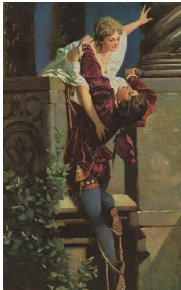
Hans Makart, Romeo und Julia www.zeno.org/nid/20000729167

Unser nächstes Bild kennen wir schon vom kubanischen Zigarrenkistchen. Der österreichische Maler Hans Makart, zu seinen Zeiten international hochberühmt, schuf diese Balkonszene 1872–76 als Teil eines Zyklus von Gemälden zu Romeo und Julia , und sie gefiel Kaiser Franz Joseph so gut, dass er sie sogleich für seine Sammlung aufkaufte: