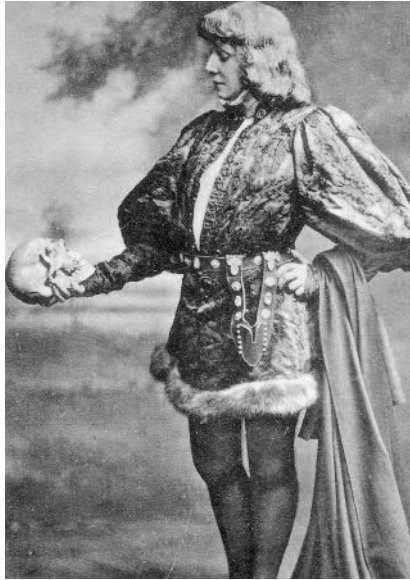
Sarah Bernhardt als Hamlet in La tragique histoire d'Hamlet. Théâtre Sarah Bernhardt, Paris 1899

Bernhardt war eine sehr selbstbestimmte Frau. Sie war eine Unternehmerin, die über eine eigene Theatertruppe verfügte und eines der großen Theaterhäuser im Zentrum von Paris gepachtet hatte, das sie in ‚Théâtre Sarah Bernhardt‘ umbenannte. Für ihren Hamlet gab sie eine eigene Übersetzung (bei Marcel Schwob und Eugène Morand) in Auftrag, in Prosa statt der bisher üblichen gereimten Alexandriner. Der neue Text war ungewöhnlich vollständig – fünf Stunden dauerte die Aufführung. Bernhardt war der Auffassung, nur Frauen könnten den Hamlet überzeugend spielen: jüngere Männer hätten nicht die ausreichende intellektualisierte Sensibilität; später seien sie zu alt für die Rolle. Sie selbst gibt einen für die Zeit neuartigen, couragierten Hamlet. Hamlet ist für sie ein tatkräftiger Rächer, und nicht mehr die zarte Seele der romantischen Interpretationen des 19. Jahrhunderts. Einer Londoner Zeitung erklärte sie: