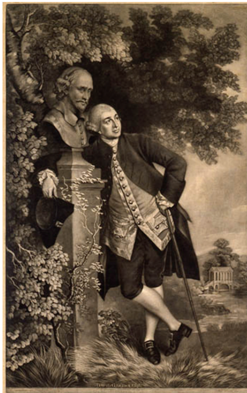
Thomas Gainsborough, „David Garrick (1717–1779) Actor, Playwright and Theatre Manager“ (1769)