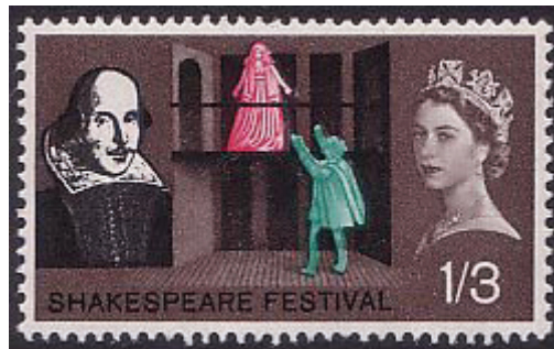
Thomson 1991: 5, 225–243 und Gurr: 1970: 96-98

Es fehlt im Text, was die erste britische Romeo und Julia -Briefmarke, die zum Shakespeare-Jubiläumsjahr 1964, feiert –