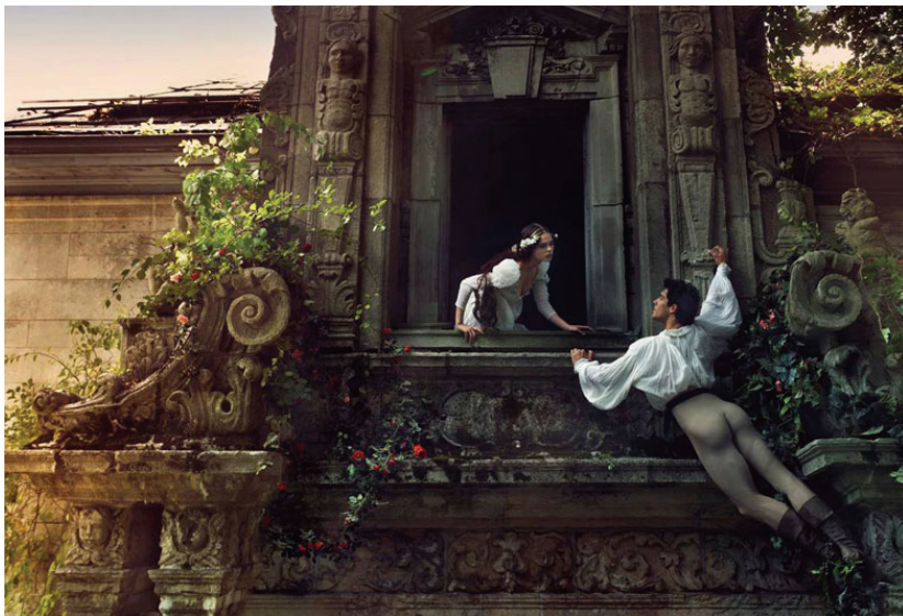
Annie Leibovitz, „On Cupid's Wings“. Vogue (December 2008)

Oder, ein letztes Beispiel, Annie Leibovitz' Photographie „Auf den Schwingen Cupidos“ für das Vogue Modemagazin, das im Dezember 2008 unter dem Titel „The Love of a Lifetime“ eine zwölfseitige Photostrecke von Romeo und Julia-Bildern in prächtiger Kostümierung vor glanzvollen italienischen Renaissance-Settings ihren modebewussten Lesern anbot: 5