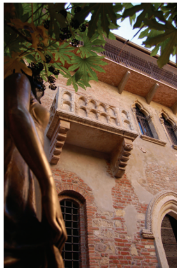
Balcone della casa di Giulietta

https://commons.wikimedia.org/wiki/File:Balcone_della_casa_di_Giulietta.jpg