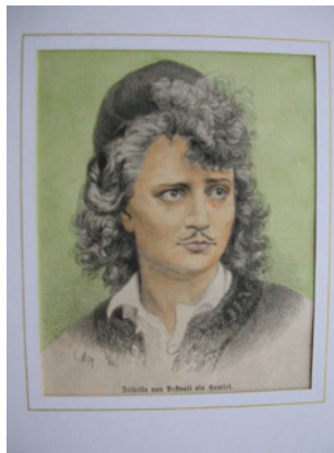
Felicitas von Vestvali als Hamlet, teilkolorierter Holzstich von 1873

Besonders beeindruckend war der Hamlet der Felicita(s) von Vestvali, einer Schauspielerin deutscher Herkunft. Als Anna Marie Stägemann 1829 in Stettin geboren, riss sie als 15jährige, als Junge verkleidet, von zuhause aus. Sie machte erst in Paris, dann in den USA eine Karriere als Opernsängerin, später als Schauspielerin. Ihr Hamlet wurde 1866 in Amerika und England allgemein bewundert; das blonde Haar der Vestvali, die männlich hochgewachsene Figur und die sonore Alt-Stimme waren, wie die Kritik feststellte, für den androgynen Charakter der Rolle ideal.