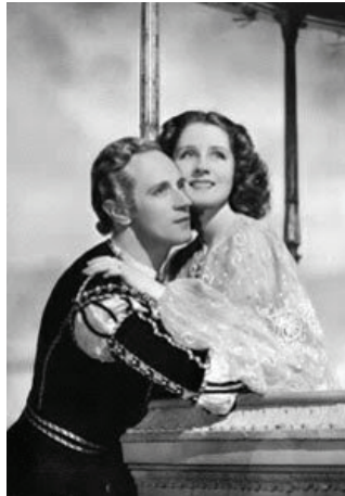
Romeo and Juliet 1936

Bildmaterial aus der italienischen Renaissance die Kostüm- und Bühnenbildner zu inspirieren. Das Ergebnis dieser Bemühungen und historische Authentizität war allerdings kaum überzeugend – und sei das auch nur, weil der siebenundvierzigjährige Leslie Howard als Romeo und die sechsunddreißigjährige Norman Shearer als Juliet nicht wirklich überzeugen konnten. Ein Standphoto mag reichen, den Mangel an jugendlicher Leidenschaft in ihren steifen Gesten zu belegen.